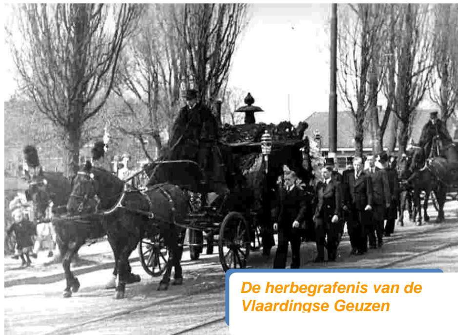
De herbegraving van de Vlaardingse Geuzen

links van de graven, gedenkstenen neergezet. Vijftien Geuzen en drie Februaristakers vonden de dood. Achttien dappere mannen die zich niet bewust waren van het gevaar. De andere Geuzen die in het 'Oranjehotel' zijn